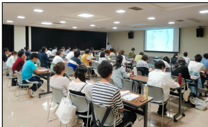
写真 1 講義の様子

平成 28 年 6 月 30 日（木）、神奈川県リハビリテーション病院にて「脊髄損傷のリハビリテーション（理解編）」セミナーが行われました。脊髄損傷のリハビリテーションに関する基礎的な知識を習得し、理解を深めることを目的とするこのセミナーは、医療職や介護職など毎回多くの方にご参加いただいております。今回も医療職や PT・OT などのセラピストの方など、約 30 名の方にご参加いただきました。（写真 1）