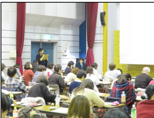
図6 高次脳機能障害セミナー実務編の様子

平成 29 年 12 月 9 日(土)、厚木シティプラザサイエンスホール 250 にて「高次脳機能障害セミナー 実務編」が開催されました(図6)。