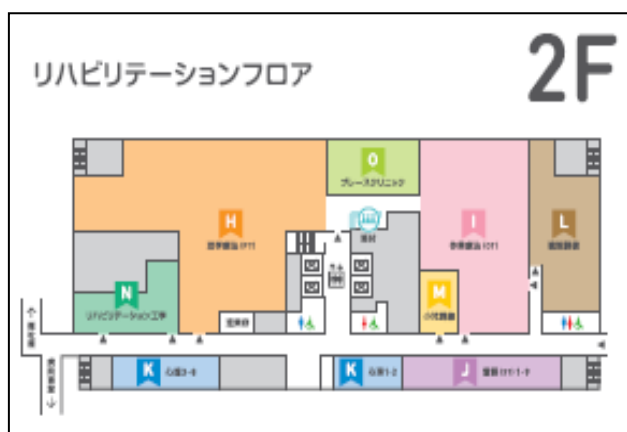
図3 2Fフロア案内図(開棟式パンフレットより)