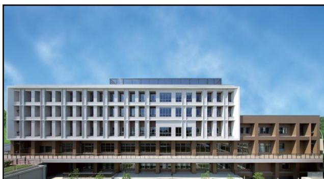
図1 新病院の概観