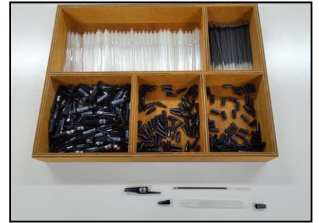
図5 ポールペン解体・部品分け

職能科には「能力開発部門」と「就労支援部門」という2つの部門があります。能力開発部門では、地域生活への移行に向けた支援を主に行っており、中には高次脳機能障がいの影響が大きく変化する時期のさなかにいる患者様も少なくありません。今回は、傷病により脳に損傷を負った方にしばしば現れる通過症候群（意識障害の改善後も、精神活動の鈍化がみられる症状）の支援事例を紹介します。